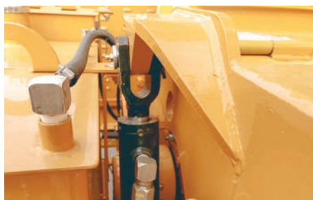
Un vérin hydraulique, de série, exerce une pression supplémentaire sur l'unique rouleau.