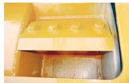
Les 2 couteaux du tambour sont faciles d'accès et simples à démonter.