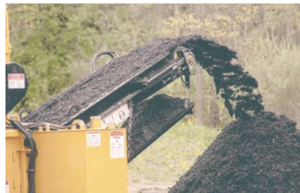
Grâce à divers aménagement de coupe, la 1425 est capable de traiter une multitude de matériaux : souches, palettes, troncs, traverses de chemin de fer...