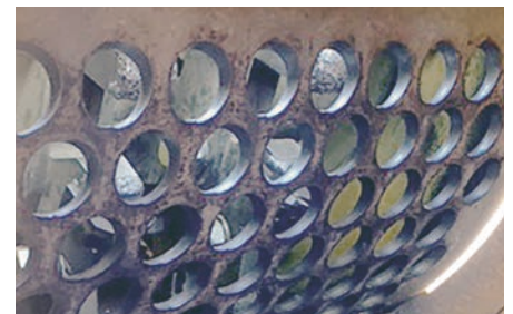
Grâce à plusieurs grilles de calibrage, le broyat est homogène et à granulométrie variable.