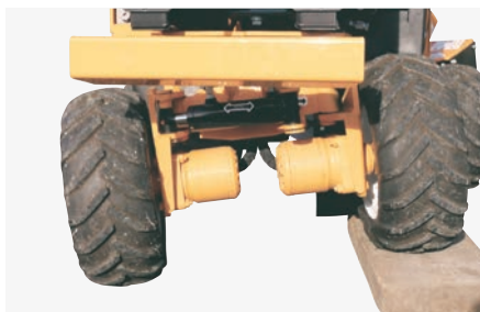
Les versions 4x4 sont dotées d'un moteur hydraulique sur chaque roue pour une meilleure motricité.