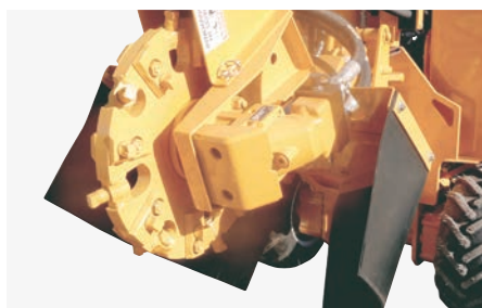
100% hydraulique. Fiabilité accrue et coût d'entretien réduit. Dents carbure robustes faciles à changer.