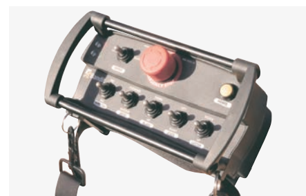
Radiocommande de série pour plus de confort, de visibilité et de sécurité.