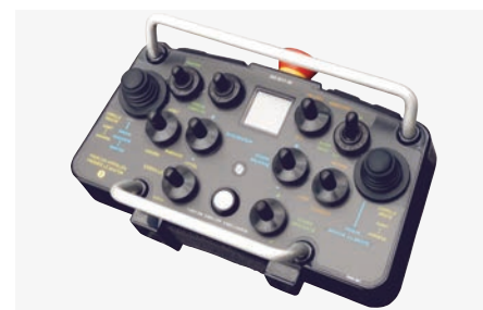
Radiocommande de série pour plus de confort, de visibilité et de sécurité.