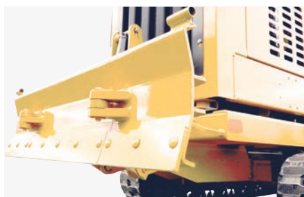
Lame de nivellement renforcée, pliable, en option.