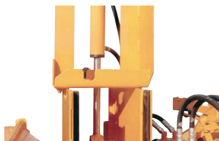
Un vérin hydraulique exerce une pression de 800 kg sur le rouleau supérieur d'alimentation.