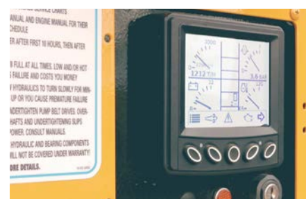
Système de régulation automatique de l'alimentation.