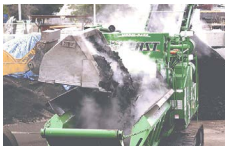
Grâce à divers aménagement de coupe, la BEAST est capable de traiter une multitude de matériaux : souches, palettes, plastiques, traverses de chemin de fer, asphalte...