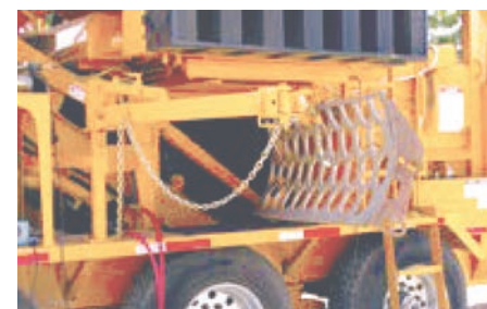
Grâce à plusieurs grilles de calibrage, le broyat est homogène et à granulométrie variable.