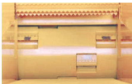
Semi-rapide, le rotor tourne à 650 trs/min. L'organe de coupe s'use moins vite et permet d'attaquer de plus gros diamètres.

La gamme "THE BEAST" propose en option un système de colorisation des copeaux, un système d'aspersion, un rotor à plaquette ou encore un rouleau magnétique enfin de récupérer les éléments métallique.